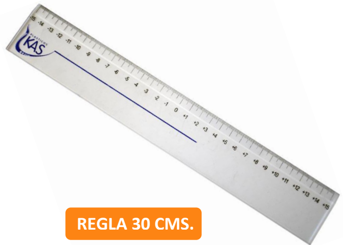
REGLA 30 CMS.