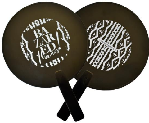
PALETA - ABANICO