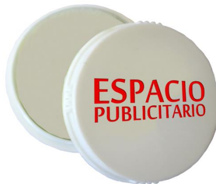
PASTILLERO EN ROSCA