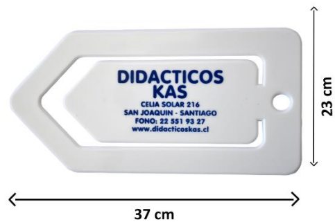
CLIP - RECETAS