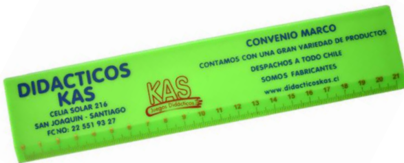
REGLA 20 CMS.