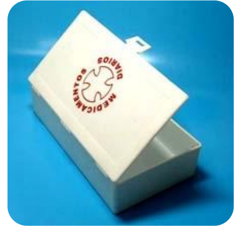
CAJA MULTIFUNCIÓN / PASTILLERO TRATAMIENTO MENSUAL