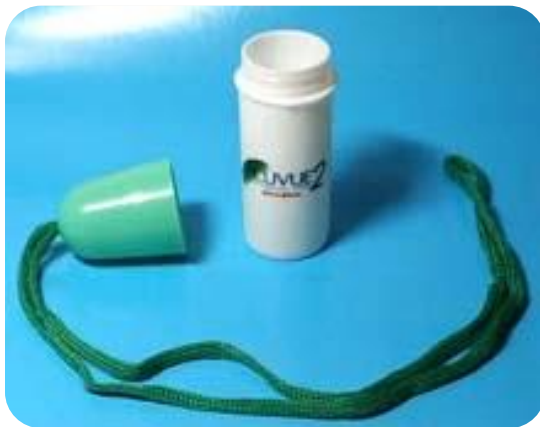
PASTILLERO AL CUELLO