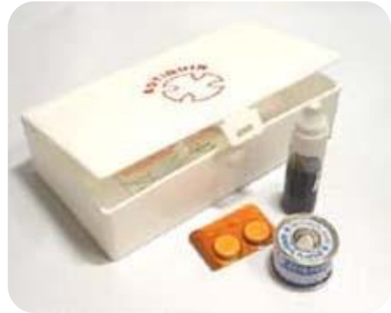
BOTIQUÍN PARA AUTOS / VIAJES