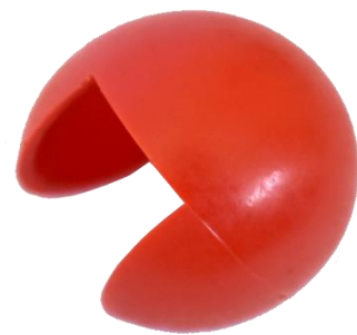
NARIZ PACH ADAMS